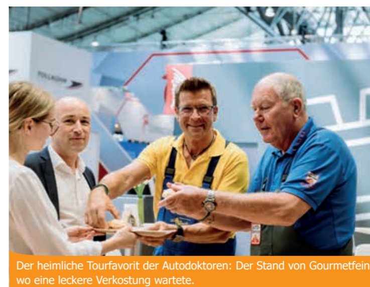
Der heimliche Tourfavorit der Autodoktoren: Der Stand von Gourmetfein, wo eine leckere Verkostung wartete.