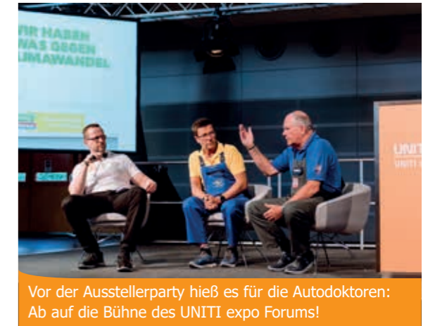
Vor der Ausstellerparty hieß es für die Autodoktoren: Ab auf die Bühne des UNITI expo Forums!