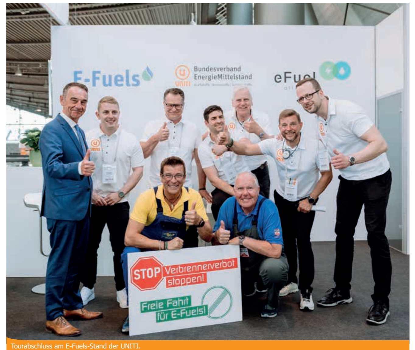
Tourabschluss am E-Fuels-Stand der UNITI.